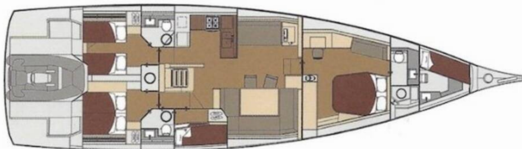
Dufour 63 Exclusive