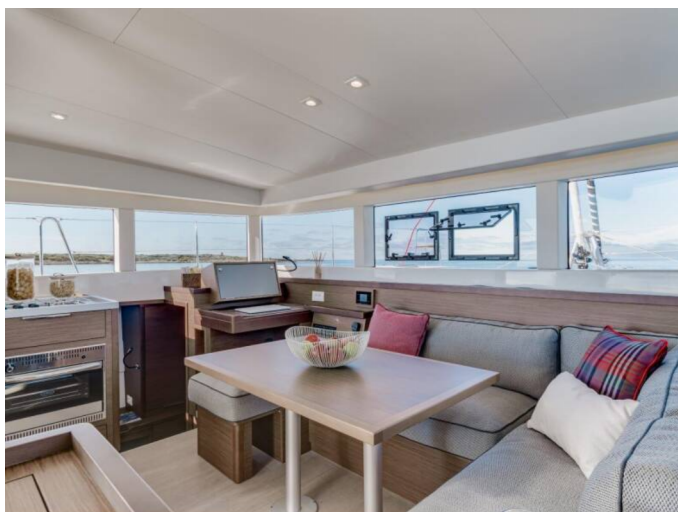
Lagoon 40 - Palma - 090917