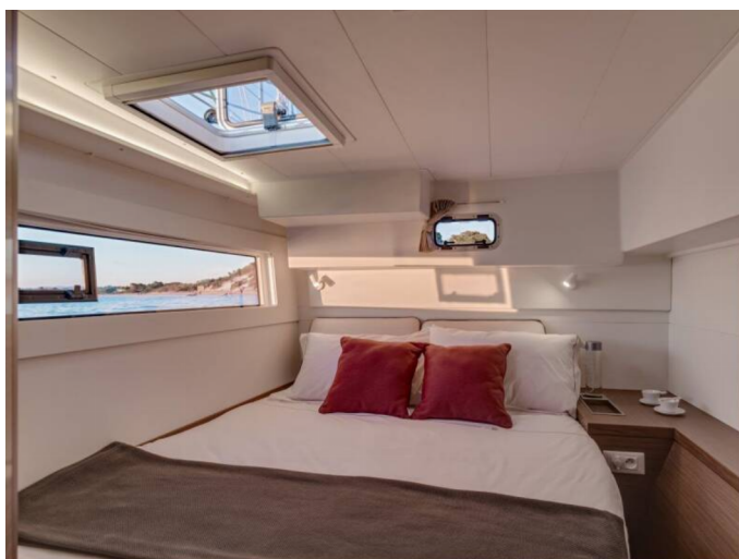
Lagoon 40 - Palma - 090917