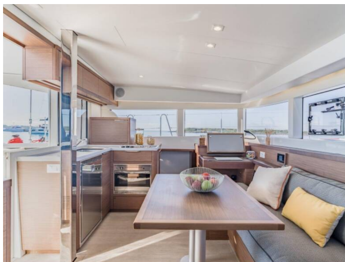
Lagoon 40 - Palma - 090917